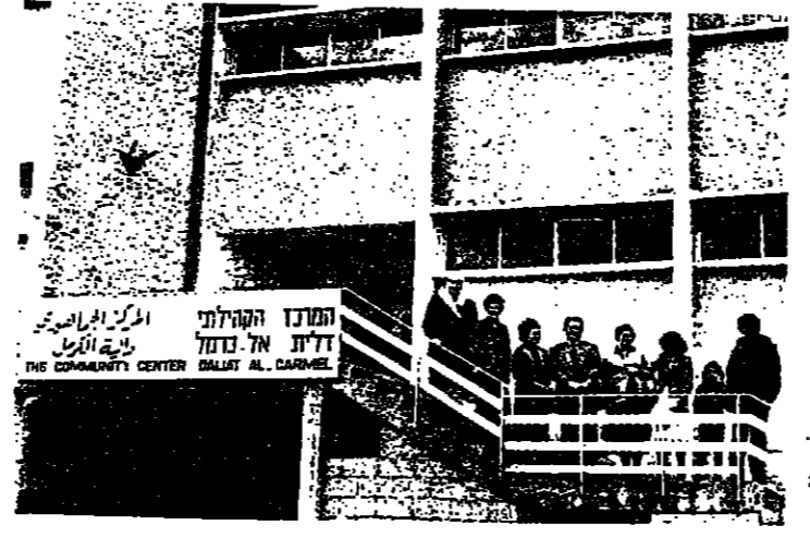
مدرسة حديثة ارضية بناه المركز الجماهيري في الطابق الارضي

وقد ناقش السيد حسون مع خطيب العديد من القضايا المتعلقة بالبلدية والمجتمع المحلي ، وبحثوا في سبل تطوير الخدمات المقدمة للمواطنين ، واهتموا بشكل خاص بالمشاكل التي تواجهها البلديات الصغيرة ، وبحثوا في سبل تحسين الخدمات المقدمة للمواطنين ، واهتموا بشكل خاص بالمشاكل التي تواجهها البلديات الصغيرة ..